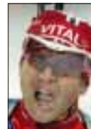
Klarer seg bra

Bjørndalen er ingen taper. Vi takker, som alltid, for opplysningen.